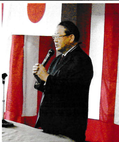
山崎 拓 会長