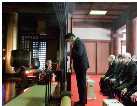
忠之公法要 東長寺本堂で焼香する理事