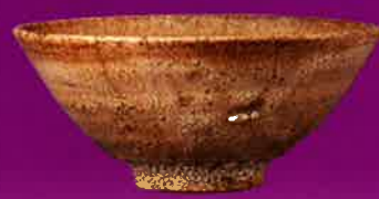
井戸茶碗 銘「奈良」 (出光美術館所蔵)

特別公開 重要文化財 金葉明最勝王經 卷十(財)大東急記念文庫所蔵は 10月24日(火)～11月5日(日)の展示