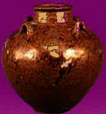
唐物茶壺 銘「蓮華王」(福岡市美術館所蔵)