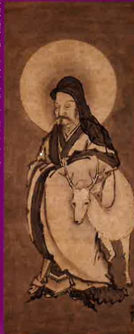
重要美術品 寿老図 (福岡市美術館所蔵)