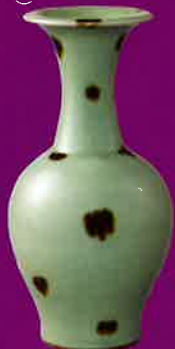
重要文化財 青磁鉄斑文瓶 (石橋財団アーテイナ美術館所蔵)