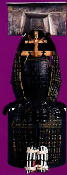
重要文化財 銀笥押 谷形兜 黒糸威五枚胴具足 小具足付 (福岡市博物館所蔵)