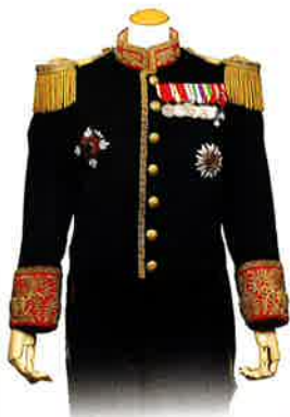
大礼服 黒田長政着用