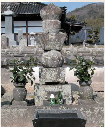
井上之房の墓(龍昌寺)

また朝鮮出兵においても後藤基次・黒田一成と共に日替わり交代で先手を務め、一度も撤退したことがなかった。ちなみに孝高(如水)が豊前に入封すると6000石の所領を与えられ、栗山利安・井上之房と共に家老職に任命されて