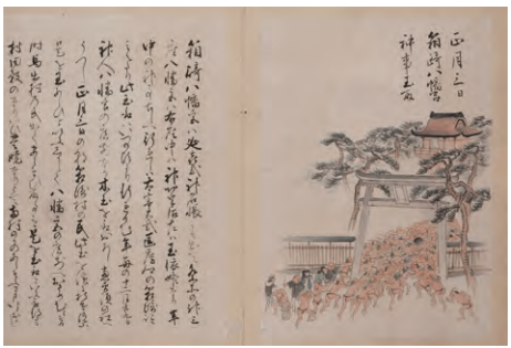
正月3日の箱崎八幡宮の神事玉取

またしても絶えるが、昭和二十四(1949)年に三度目の復興を遂げ、現在の博多どんたくの中で福神・恵比寿・大黒流の通りもんと稚児舞いとして続いている。「筑前歳時図記」は国立公文書館に所蔵されており、短いまとまった文章の中に筑前の民俗・行事がきれいな文字で書かれ、挿絵も祝詞至善さんや西島伊三雄さんを彷彿とさせるタツチで描かれている。