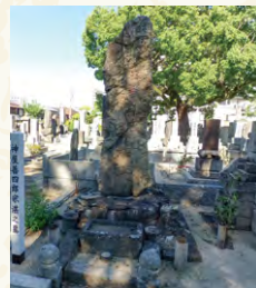
博多・妙楽寺にある神屋宗湛の墓

後、客殿で古溪和尚に会い、香をひと焚きして剃刀を三度当てられた。後は僧たちの手で髪が剃られ得度して法体となった。その日はそのまま