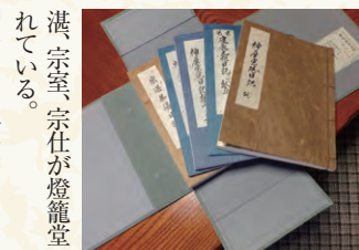
「博多文琳」を黒田家へ 茶入れの名品と言われる博多文琳は中国明時代の焼物で、中国では薬入れまたは薬味入れとして使われていた。秀吉がこの茶入れを欲したが、頑として譲らなかつた。同じように嶋井宗室も「檜柴肩衝」を決して譲らなかつた。これは秋月家の家臣によって盗み出される。そして成敗を免れるために秀吉へ献上される。「博多文琳」については神屋家文書の中の「宗湛由緒書」にある原文を読み下し文にしてみる。

「博多文琳の茶入れ、忠之公召上げさせられ候節、左の通り御判物頂戴仰付られ候」と題して、次の書をいただいた。