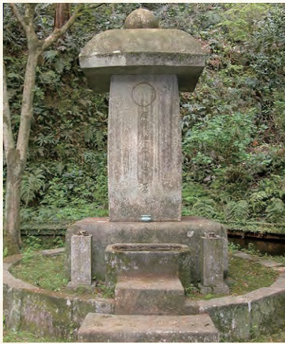
井上之房の墓(龍昌寺)

播磨姫路の住人、井上之正の次男。小寺(黒田)職隆に仕え、その後職隆の嫡子である小寺(黒田)孝高に仕える。孝高の側近、重臣として活躍、孝高が豊前に入封すると、6000石の知行を与えられる。1600年、孝高改め如水が領土拡張を開始すると、これに従軍して豊後石垣原の合戦に参戦した。石垣原の合戦では、敵方・大友方の有力武將、吉弘統幸を一騎打ちの槍合戦で討ち取るという武功を上げた。統幸は敵味方共に名を知られた武勇者で、立花統虎(宗茂)の従兄弟に当たる人物であった。この後も之房は、如水に従い豊後安岐城、同富来城、豊前香春岳城、同小倉城の攻略戦に参戦している。そして如水・長政父子が筑前へ入封すると遠賀