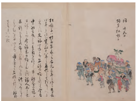
正月15日の博多松囃子

続いて正月十五日の博多松囃子の記述ではその起こりが、安元三(1177)年に平重盛の恩恵を謝すために始まり、慶長四(1599)年に絶え、再び寛永十八(1641)年興るが、明治五(1872)年に福岡県の通達によって山笠や盆踊りとともに禁止された。それでも明治十一(1878)年の紀元節の祝いや大正天皇、昭和天皇の即位大典には参加していた。戦時色が強まる中、昭和十三(1938)年